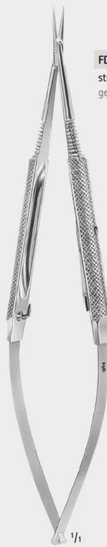
FD242R straight gerade