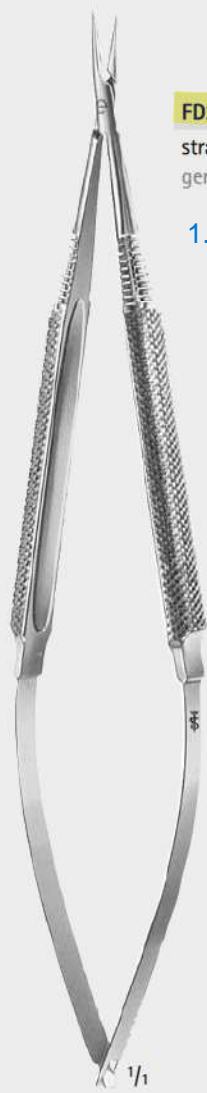
FD240R straight gerade